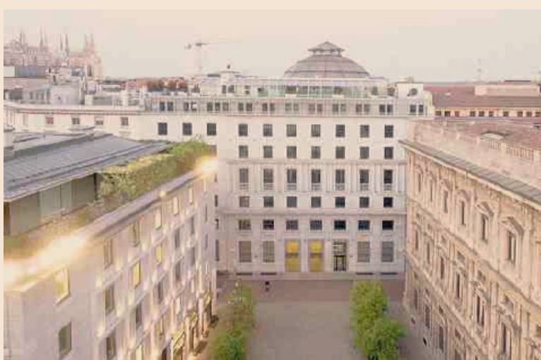
Dietro il Duomo. Il rendering dell'edificio di piazza San Fedele